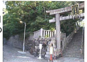
↑大阪国学院があった所

明治41年、神職養成のため、大阪国学院が当神社南西(階段下北側)に設立され、明治43年に財団法人化されました。大正12年に住吉区山之内(今の浪速学院)に移築移転し、中学校が設置されるまでの15年間、多くの神職を排出しました。現在は中央区の大阪府神社庁内にあります。