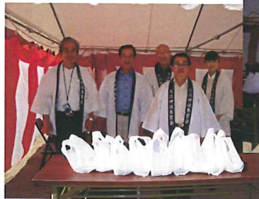
←お手伝いの総代の皆さん