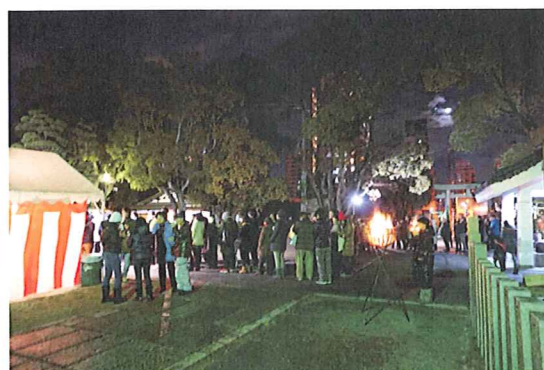
↑鳥居まで続く行列