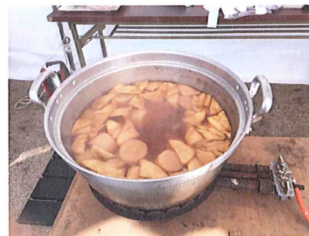
↑一昨年からの大根焚き