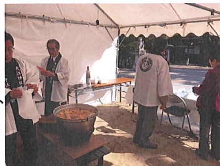
↑総代によるご接待