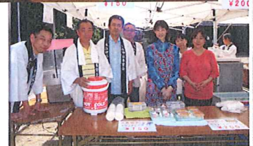
↑ 桃陽地域の皆さん