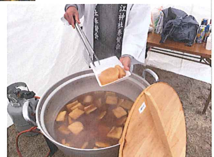
↑美味しい布引大根

毎年2月立春前日に斎行されます。冬と春との季節の分かれ目に行なわれるこの節分祭には、除疫・招福が祈願されます。当神社では、朝10時より参詣の皆様方に、総代崇敬者のご奉仕により、お神酒と大根焚きのご接待をさせて頂きました。