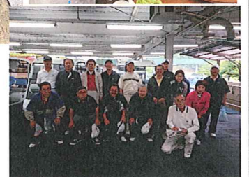
↑昨年春のコンペにて